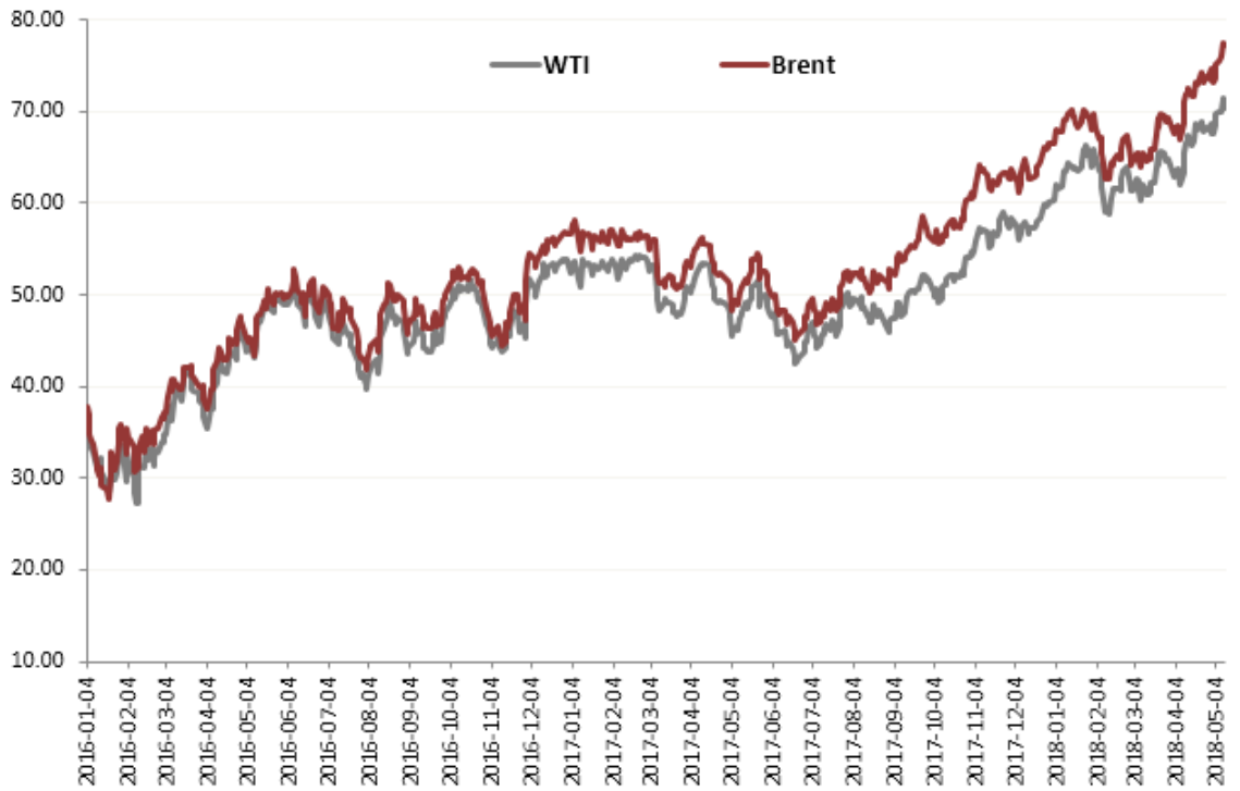
图一：美原油、布伦特原油主力合约走势